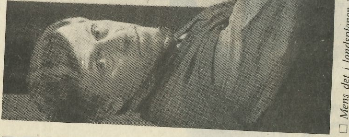
□ Mens det i landsplanen fra 1986 antydes at en framtidig nasjonalpark i Forelhogna-området bør omfatte 600 kvadratkilometer, foreslår det lokale arbeidsutvalget at parken bør være på cirka 1 000 kvadratkilometer. Utvalgs-

Sammenlignet med forslaget i NOU 1986:13, går arbeidsutvalget inn for å øke nasjonalpark-området betraktelig. Mens Gjærevol og hans folk antyder cirka 600 kvadratkilo-